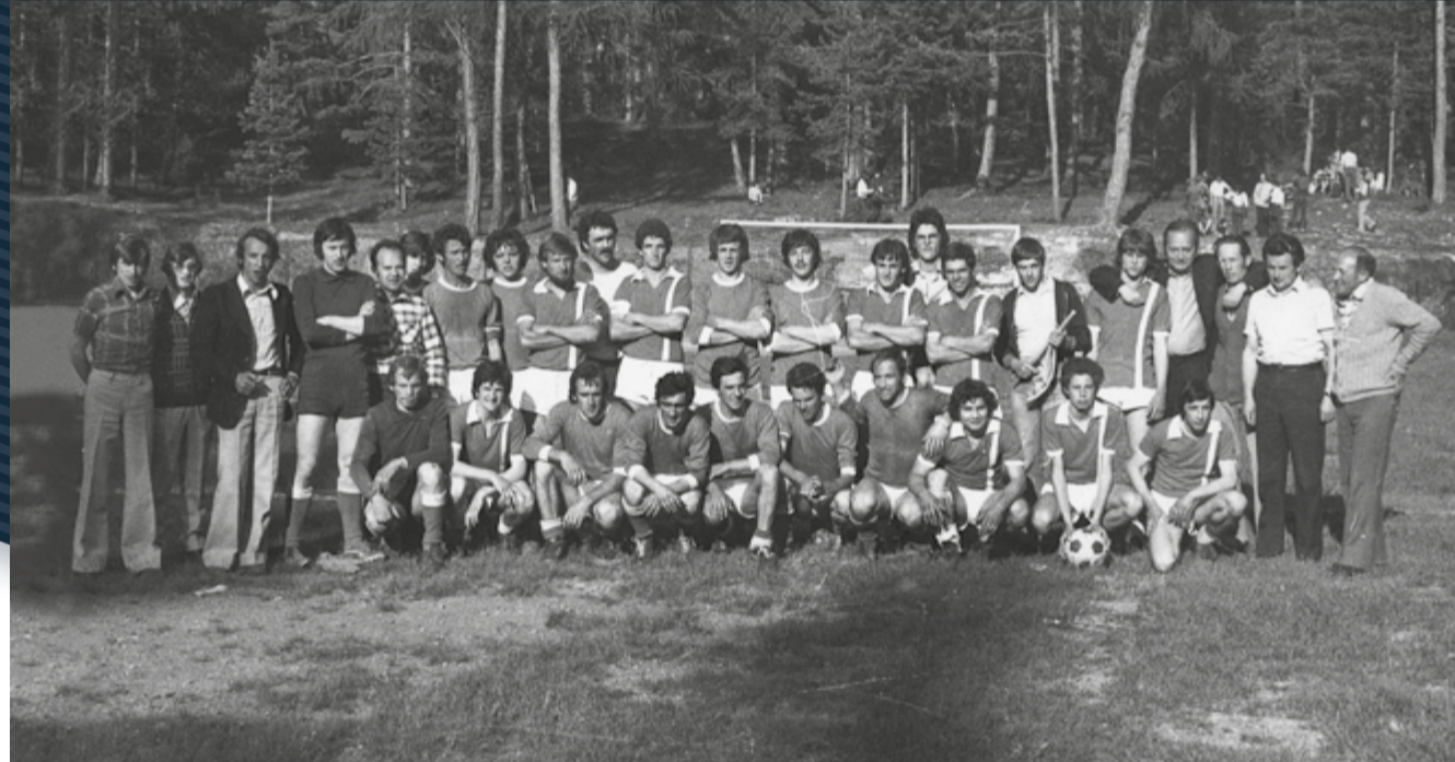
Campo di Cavareno '73