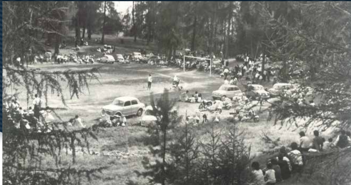
Campo di Cavareno '68