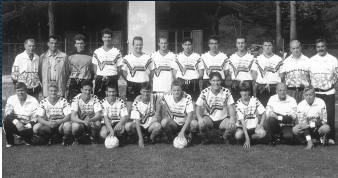
Campo di Cavareno'96

Via F. Filzi, 20 - CASTELFONDO 38020 BORGO D'ANAUNIA (TN) Tel. 0463 830512 - Fax 0463 839581 alco@alcosnc.191.it