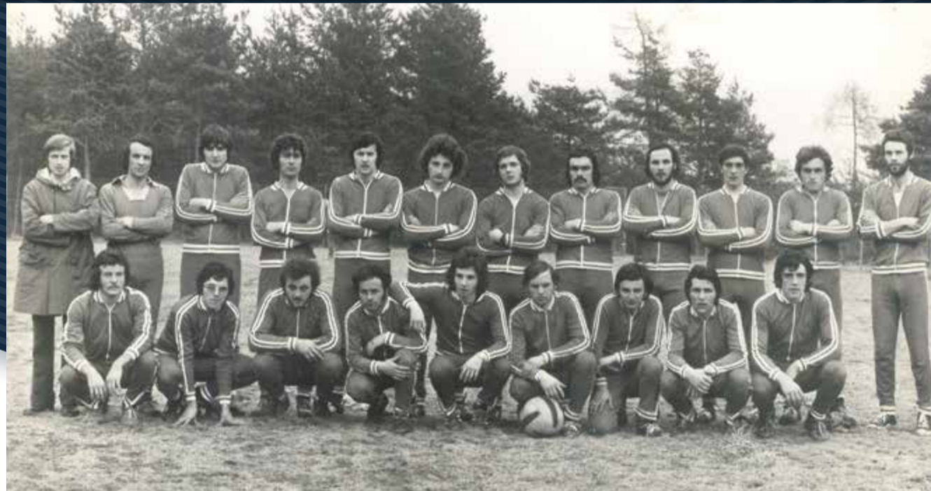
Campo di Cavareno '73