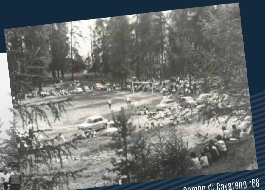
Campo di Cavareno '68