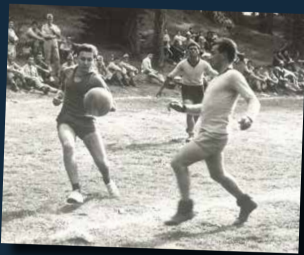
Campo di Cavareno '66