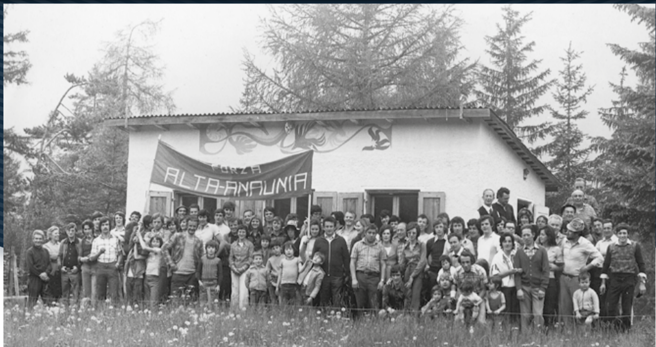
"bait del Zambo" Castelfondo '73