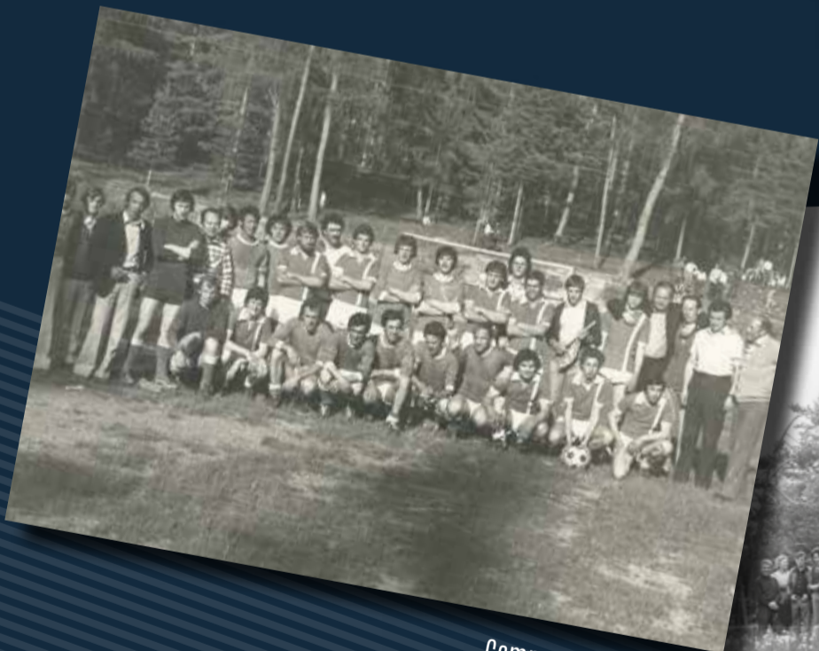
Campo di Cavareno '73