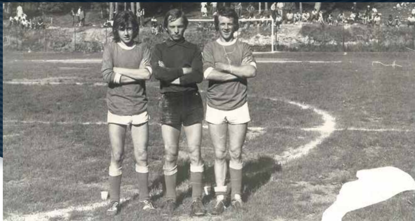
Campo di Cavareno '76