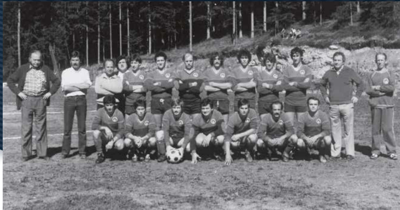
Campo di Cavareno '80