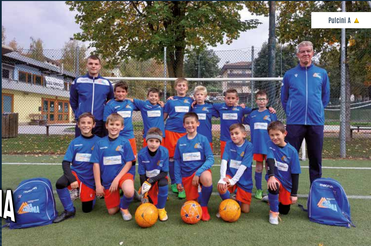
Pulcini A ▲

50 ALTA ANAUNIA 1973-2023 CINQUANTESIMO ANNIVERSARIO Associazione Calcio