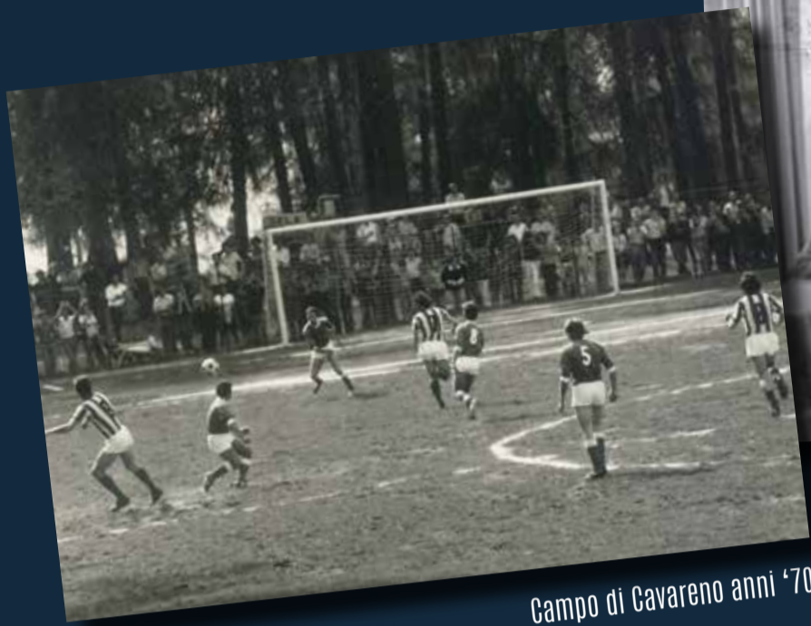
Campo di Cavareno anni '70