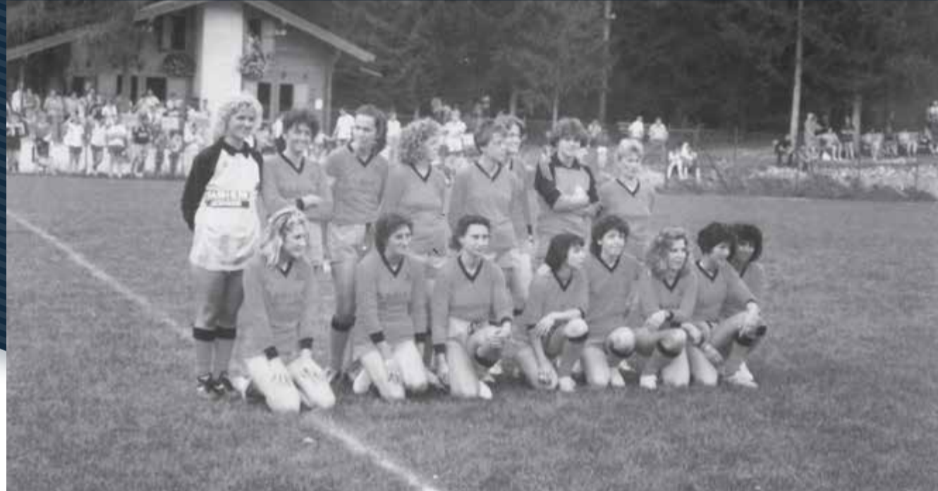
Campo di Cavareno '90