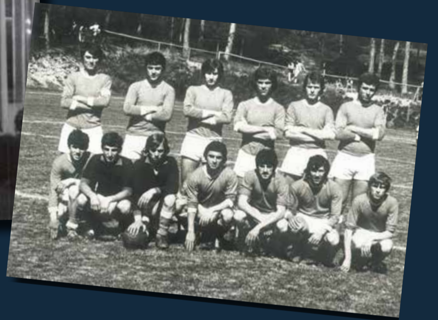
Campo di Cavareno '69