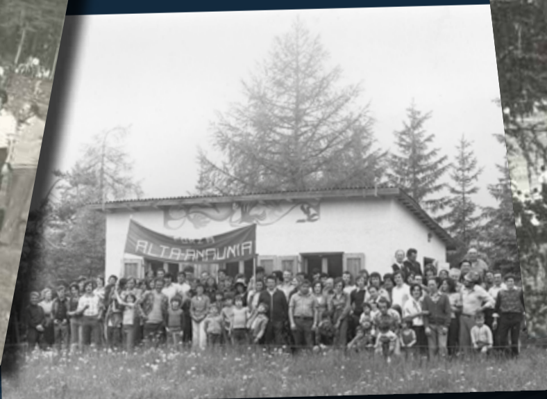
"bait del Zambo" Castelfondo '73