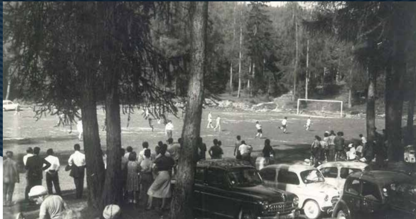
Campo di Cavareno '68