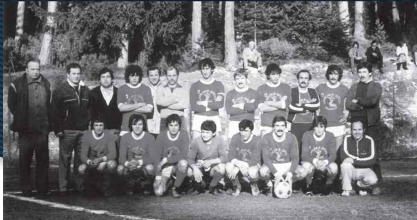
Campo di Cavareno '80