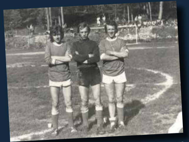
Campo di Cavareno '76